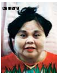
Camera #1 janv/fev/mars

Créée en 1922, disparue en 1982, la revue Camera est demeurée l'une des références absolues de la photographie du xx e siècle. Trente ans après sa disparition, elle a reparu en janvier 2013, fidèle à sa vocation première : publier les œuvres des plus grands photographes contemporains et donner à un large public, amateurs, photophiles et collectionneurs, les repères pour en apprécier la portée.