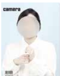
Camera #3 juil/août/sept