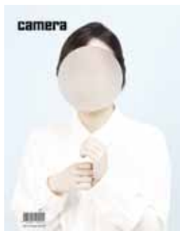
Camera #3 juil/août/sept