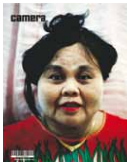
Camera #1 janv/fév/mars