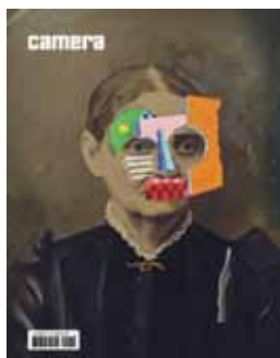
Camera #4 oct/nov/déc