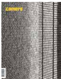
Camera #5 fév/mars/avril